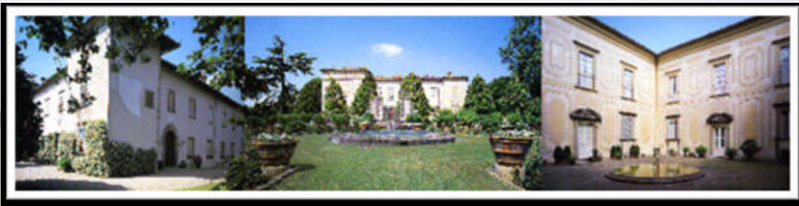
Vedute degli esterni e del cortile interno