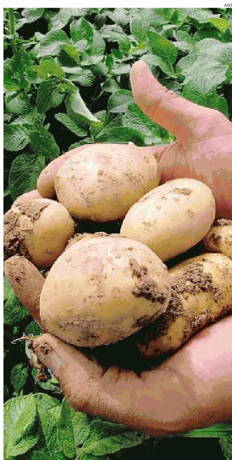
► La patata Amflora

GLI AMBIENTALISTI nel Parlamento di Strasburgo sono scioccati e in Italia si leva forte una voce di protesta. Tutti contrari tranne il Vaticano: il Cancelliere della pontificia accademia per le scienze, Marcelo Sanchez Sorondo, dice che la nuova patata contribuirà a risolvere la fame nel mondo. Durissimo il ministro delle Politiche agricole, Luca Zaia: «Non solo non ci riconosciamo in questa decisione, ma non permetteremo che questo metta in dubbio la sovranità degli Stati membri in materia. Da parte nostra, proseguiremo nella politica di difesa e salvaguardia dell'agricoltura tradizionale e della salute dei cittadini. Non consentiremo che un simile provvedimento, calato dall'alto, compromet-