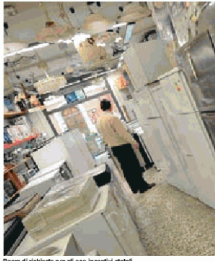
Boom di richieste per gli eco-incentivi statali

La riforma sugli Ordini professionali «si è fermata più volte in Parlamento, ma ora ci siamo noi e sono fiducioso che la porteremo a termine». E quanto afferma il ministro della Giustizia Angelino Alfano, al termine dell'incontro con gli Ordini professionali al ministero della Giustizia.