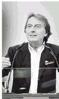
Luca Cordero di Montezemolo concluderà la prima giornata del XIII Congresso nazionale dei dottori agronomi e forestali

Sarà ripercorso uno spaccato della storia dell'agricoltura e dell'agroalimentare italiano che nel corso dei decenni si è sviluppato lungo la via Emilia, ma non solo. Sarà soprattutto l'occasione per tracciare un aggiornamento puntuale e dettagliato sullo stato attuale di una