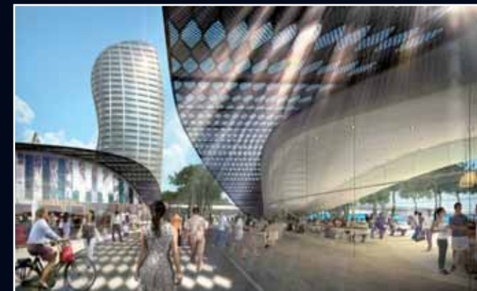
figura come un insieme di strutture che costituiranno un punto di attrazione turistica internazionale per tutto l'anno. È previsto infatti un nuovo fronte lungomare per le passeggiate e attività sociali, che contribuirà ad estendere la cultura e la storia di una città ad ispirazione fortemente balneare pur presentandosi nella sua natura ur-