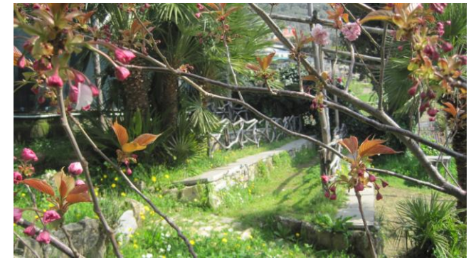
Aula all'aperto dell'I.I.S. "B. Marsano"

Il 31 marzo del 1882 fu conclusa la convenzione tra il Governo del Re e Bernardo Marsano e il 19 agosto