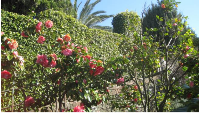
Giardino ottocentesco dell'Istituto Marsano