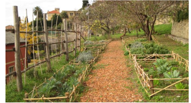
Elemento del parco didattico del giardino storico

Verrà redatta una mozione finale da sottoscrivere al termine dei lavori.