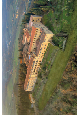
Veduta aerea dell'ex-Convento di Giaccherino.

Quelle di quest'anno è la terza edizione di “Vestire il Paesaggio”, dopo quelle del 2007 e del 2010 – l'evento, infatti, ha cadenza triennale – ed avrà come scenario l'ex-Convento di Giaccherino, ma si svilupperà anche a Palazzo De Rossi, con la 7ª edizione del Premio Pietro Porcinai e del Premio Angelo Tosi.