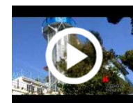
Vizi e sfizi: ecco le stranezze degli immobili di lusso

Vuoi aprire una attività? Guarda le migliori opportunità di franchising operative in Italia! www.betheboss.it