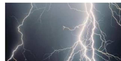
Fulmine colpisce una scuola in Tanzania: muoiono 6 bambini e l'insegnante